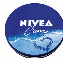
„Die Schneeweiße“ (Lat. nivea)

Bei der Übersetzung sind Findigkeit und Ausdauer gefordert. Die SchülerInnen entwickeln Lösungsstrategien zur Entschlüsselung der Texte , überprüfen ihre Ergebnisse überprüfen und korrigieren sie ggf. Somit trainieren sie „detektivische“ Fähigkeiten, aber auch kreative und eigenständige Denkprozesse , Durchhaltevermögen und Genauigkeit. All diese Fähigkeiten sind hilfreich für die Schullaufbahn oder für ein späteres Studium. Wer Latein gelernt hat, lernt nachweislich im Studium besser (nach Lebek, Universität Köln).